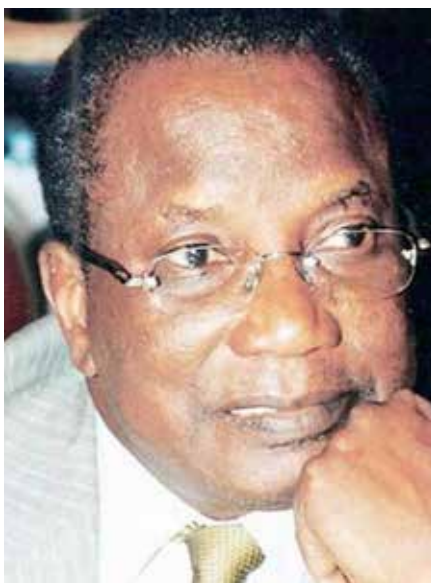
Par Pr Kader BOYE

2 – Cette disposition ne peut être révisée que par une loi référendaire.