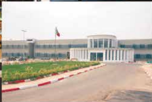
Hôpital Régional de Kaffrine