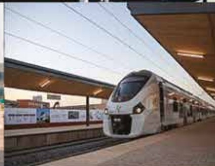
Gare TER de Kour Mbaye Fatick et de Thiaroye