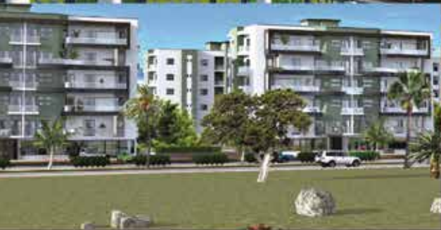
Les Résidences de l'Espoir Diamniadio