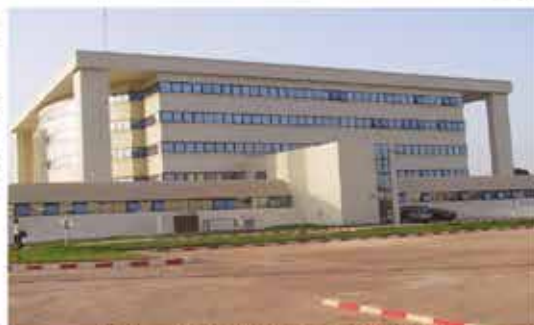
Siège de la BCEAO à BISSAU