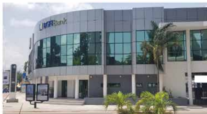
Siège BGFI Bank Brazzaville