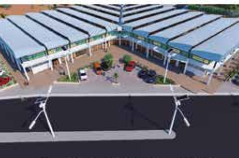
Marché de DJOUGOU au Bénin