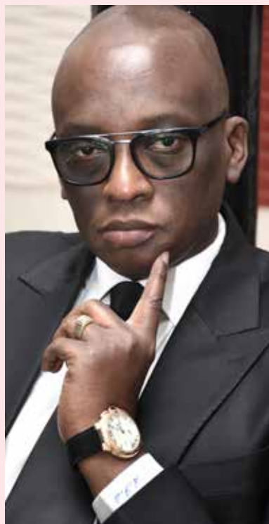
• Par Abdoulaye Fofana SECK

A u Sénégal, les vingt-quatre mois écoulés, situés à mi-mandat du Président Macky Sall, ont donné lieu à la constatation de la multiplicité et de la non linéarité des modalités d'expression et de réalité de l'exercice démocratique.