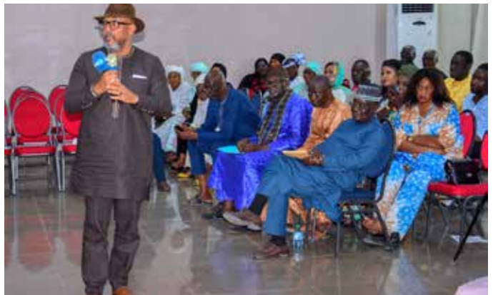
Le journaliste Charles Faye