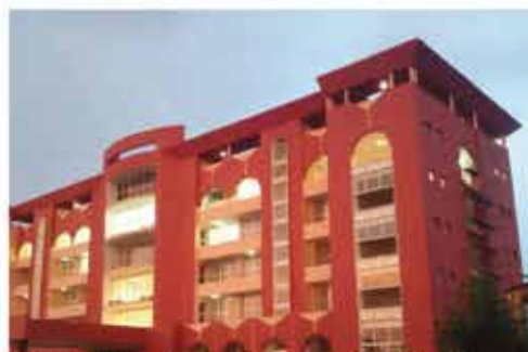
Direction de la Douane du Tchad