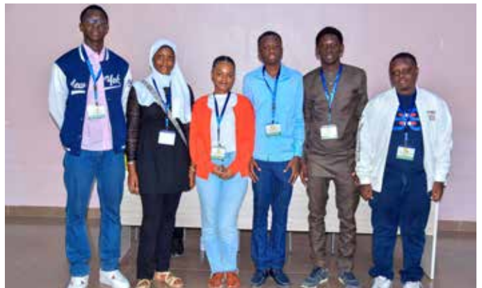
Des membres du comité d'organisation du S2C