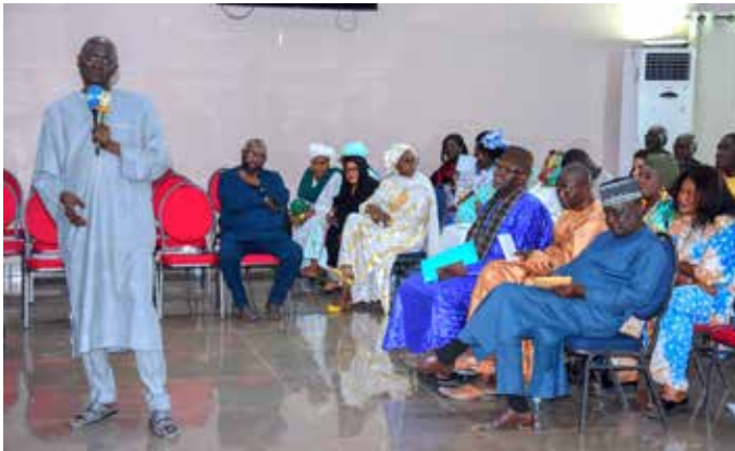
Le journaliste Issa Sall