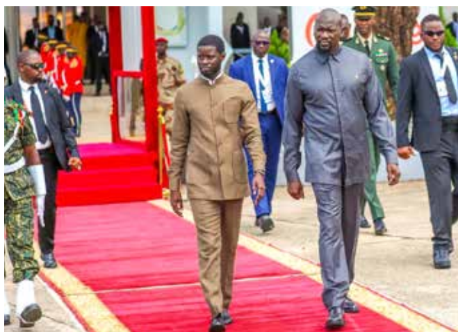
Avec le Général de corps d'armée Mamady Doumbouya de la Guinée