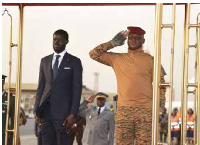
Avec le Capitaine Ibrahim Traoré du Burkina Faso