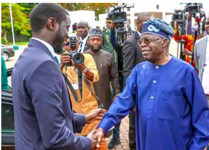
Avec le Président du Nigeria, Bola Tinubu

Aussitôt après son entrée en fonction, le président Bassirou Diomaye Faye a entrepris une dynamique action diplomatique qu'il a consacrée à des visites officielles et de travail dans la sous-région. Cette diplomatie de bon voisinage porte la marque d'une nouvelle démarche qui, cependant, ne rompt pas avec la tradition du Sénégal, reconnu comme un pays qui compte dans ce domaine.