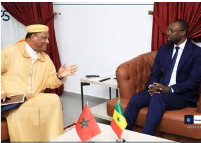
... du Maroc, ...