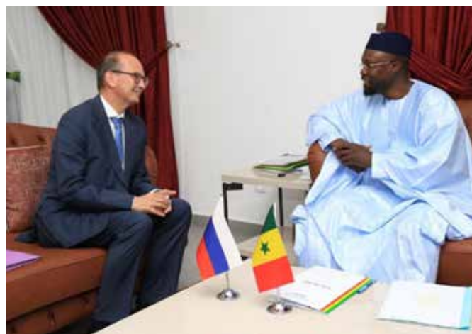
... de la Fédération de Russie, ...