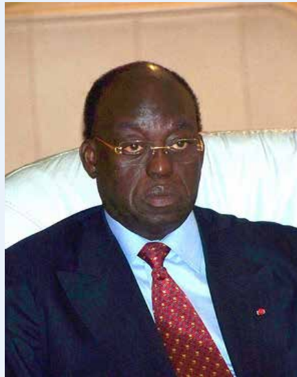
Le Premier ministre Moustapha Niasse