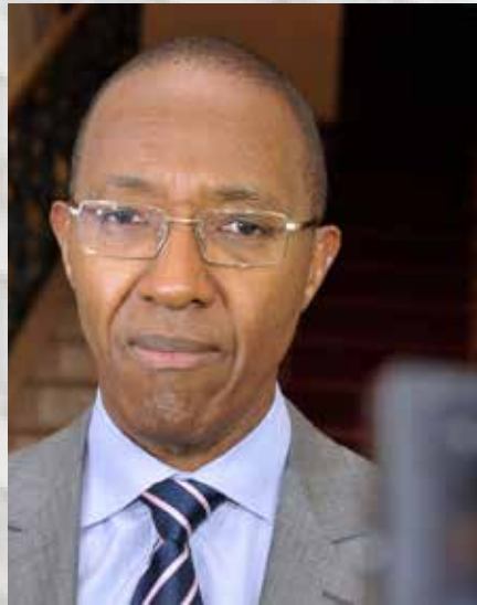
Le Premier ministre Abdoul Mbaye