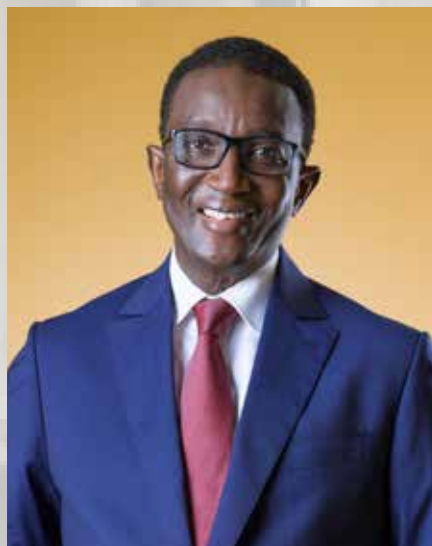
Le Premier ministre Amadou Ba