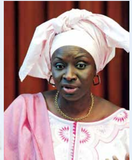
Le Premier ministre Aminata Touré