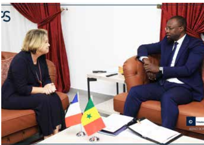
... de la France, ...