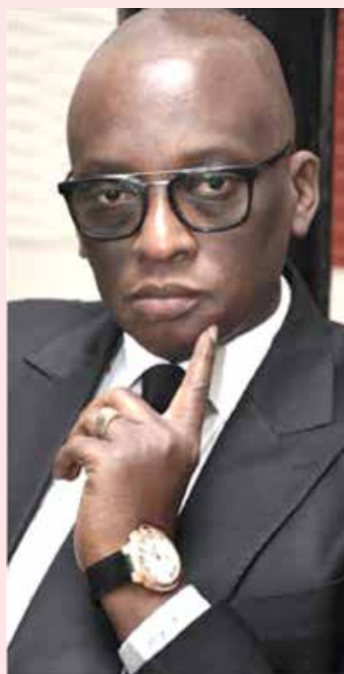
• Par Abdoulaye Fofana SECK

L'Omni-scient et L'Omni-potent Allah, le maître des destins et le peuple sénégalais l'ont voulu ainsi, faire d'une pierre deux coups : un Président de la République pour bénéficier d'un duo, Bassirou Diomaye Faye et Ousmane Sonko, appelés à piloter l'embarcation Sénégal, vers le cap de la prospérité, en voguant sur les flots cléments de la souveraineté et du panafricanisme.