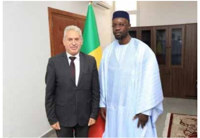
... de la Palestine, ...