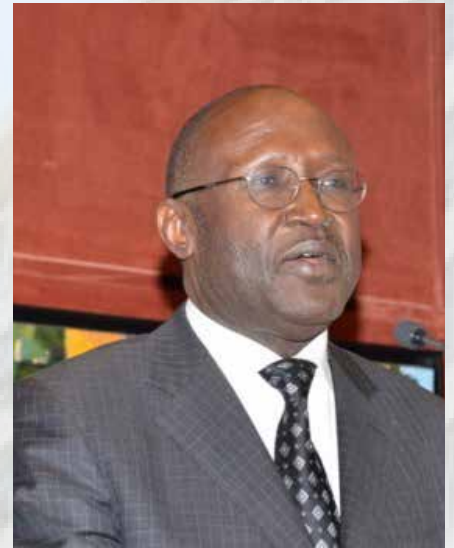
Le Premier ministre Mamadou Lamine Loum