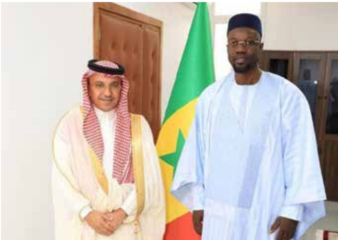
... de l'Arabie Saoudite, ...