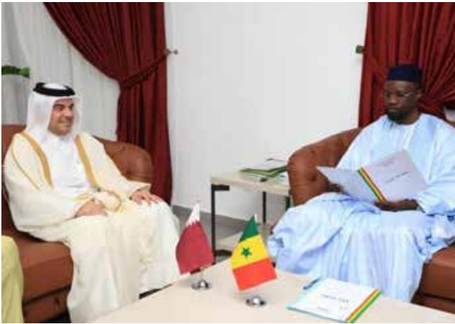
... du Qatar, ...