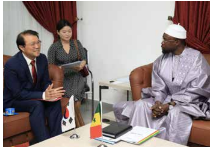
... de la Corée, ...