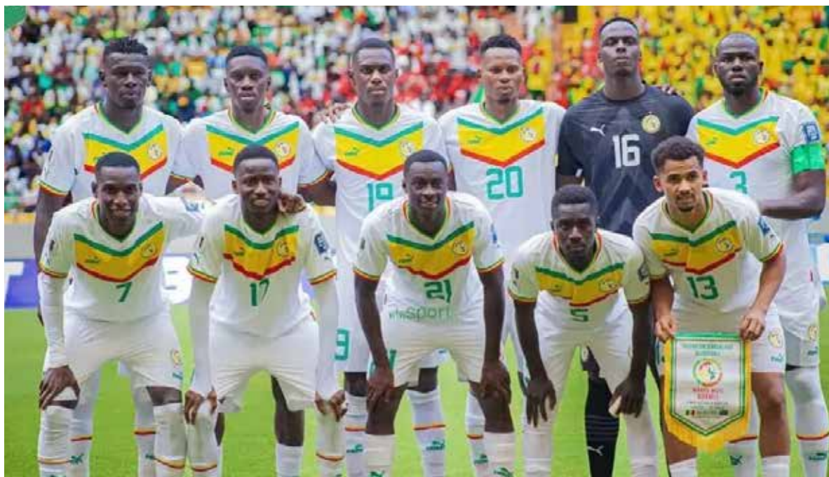
Le Onze de départ des Lions contre la RDC