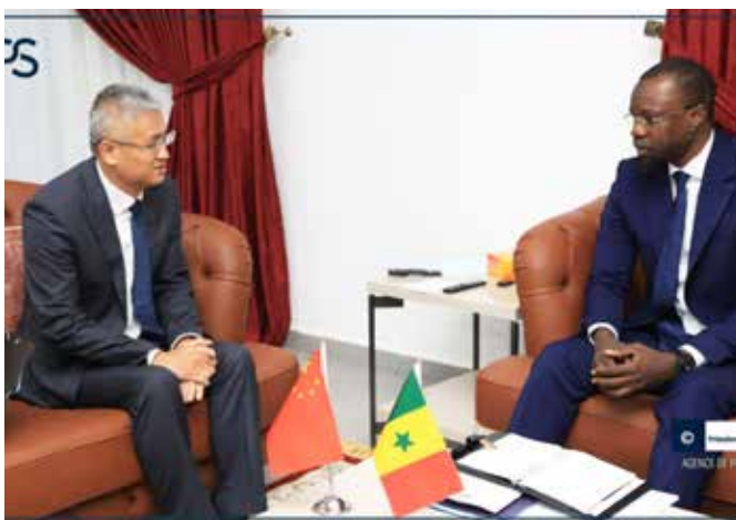
Ousmane Sonko reçoit l'Ambassadeur de la Chine,

Le Premier Ministre, Ousmane SONKO a reçu en audience des Ambassadeurs accrédités au Sénégal. Il s'agit des Ambassadeurs de la Chine, des États-Unis d'Amérique, de la France, de la Fédération de Russie, du Qatar, de la Palestine, de l'Arabie Saoudite, de la Corée, du Maroc, et de la Mauritanie. Des audiences qui s'inscrivent sans doute dans la nouvelle orientation diplomatique et géostratégique des nouvelles autorités dont la gouvernance affiche leur option souverainiste et panafricaniste.