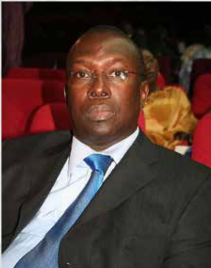
Le Premier ministre Souleymane Ndéné Ndiaye