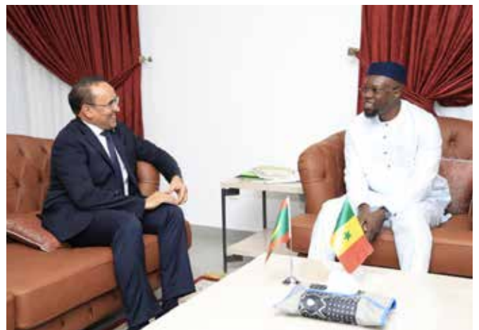
... de la Mauritanie.