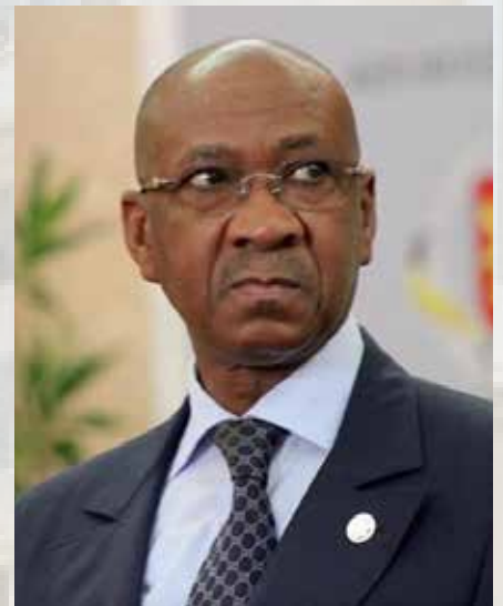
Le Premier ministre Cheikh Hadjibou Soumaré