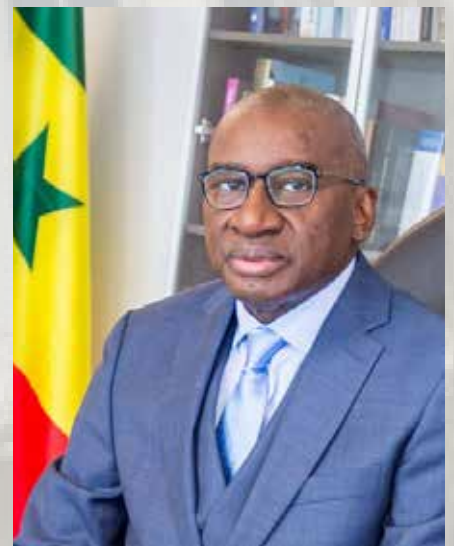
Le Premier ministre Sidiki Kaba