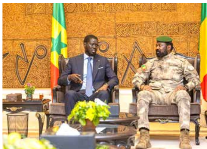
Avec le Colonel Assimi Goita du Mali