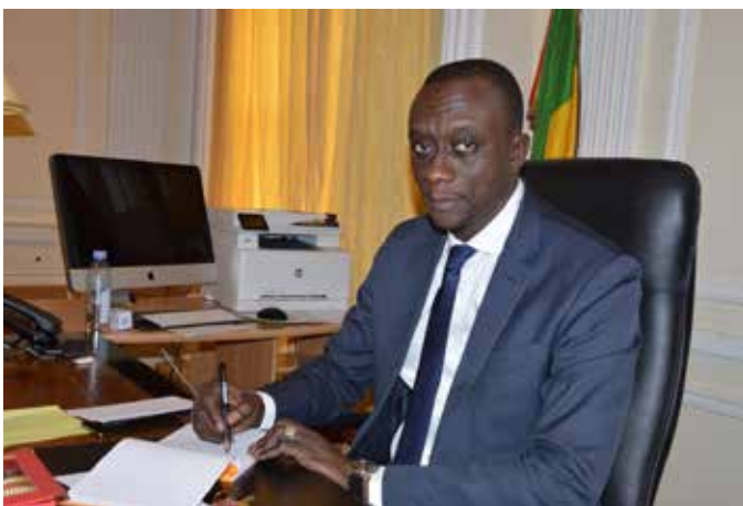
Son Excellence Magatte Sèye ambassadeur du Sénégal en France