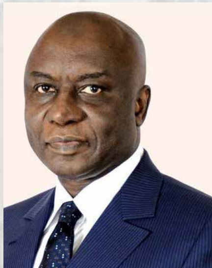
Le Premier ministre Idrissa Seck