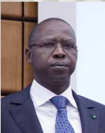
Le Premier ministre Mahammed Boun A. Dionne