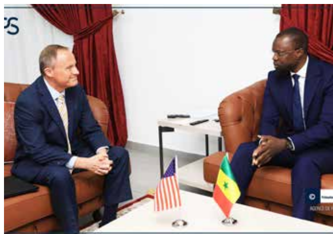
... des États-Unis d'Amérique, ...