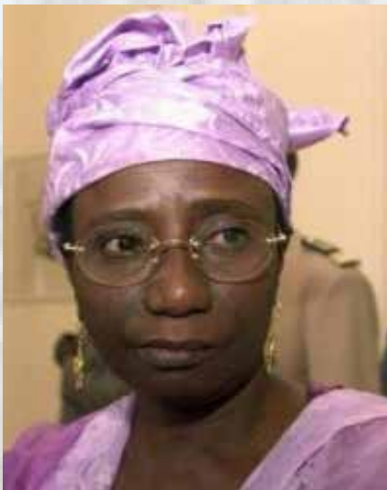
Le Premier ministre Mame Madior Boye

Elle a été limogée de son poste de Premier Ministre dans au lendemain du naufrage du bateau Le Joola en septembre 2002.