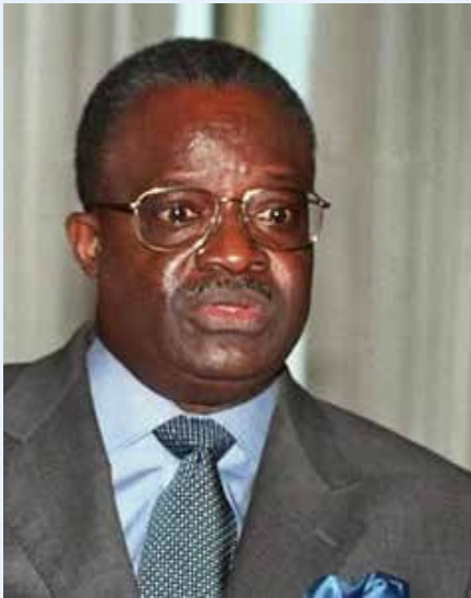
Le Premier ministre Habib Thiam