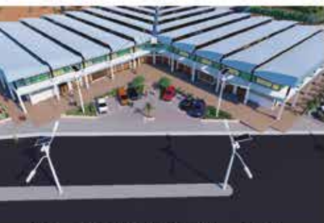
Marché de DJOUGOU au Bénin