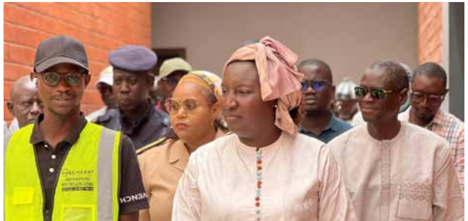
Visite du chantier de construction de la Maison de la jeunesse et de la citoyenneté (MJC) de Bambey.