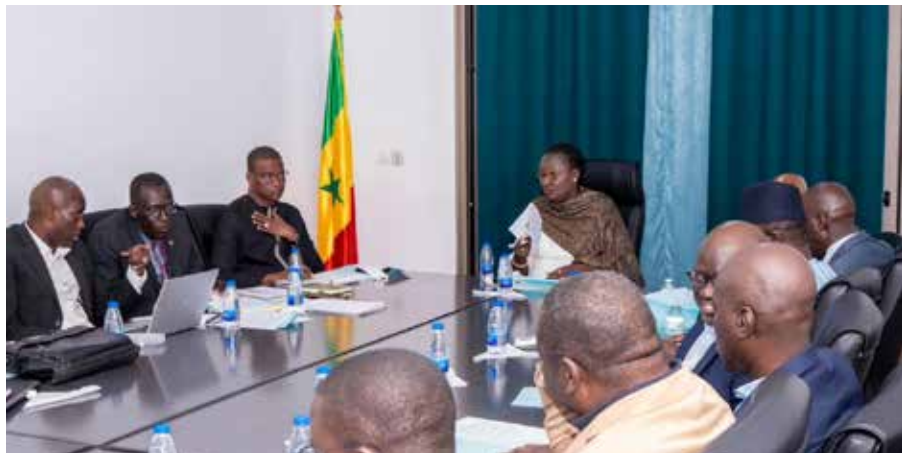
Madame Khady Diène GAYE, Ministre de la Jeunesse, des Sports et de la Culture, avec les différentes composantes du mouvement sportif sénégalais pour discuter de la réforme du cadre juridique du sport au Sénégal.