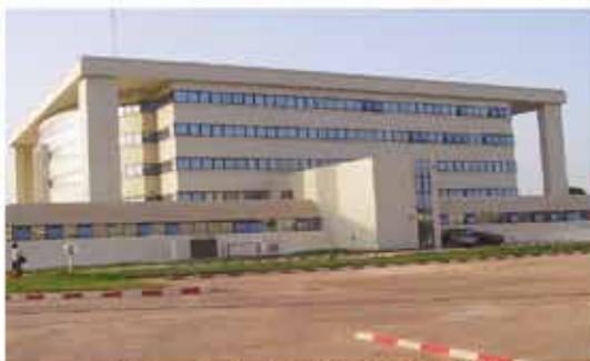
Siège de la BCEAO à BISSAU