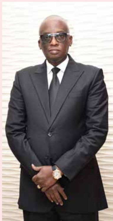
• Par Abdoulaye Fofana SECK

D ans l'ordre des priorités pressantes dont la prise en charge satisfaisante d'un Sénégal juste, prospère et souverain figurent au premier plan la restitution à la jeunesse d'un espoir réel en un présent plus supportable, l'accès à l'emploi et le recouvrement d'une dignité ramenée à sa plus simple expression par le chômage endémique, la pauvreté morale et l'indigence sociale. Le sport en tant que loisir mais aussi liant social et activité à fort impact économique relève des leviers d'une telle ambition.