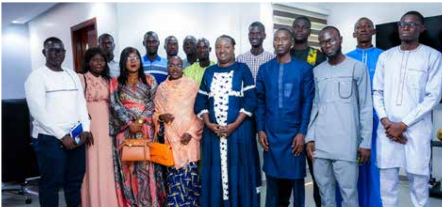
Avec le collectif des agents conseillers en emploi de l'Agence nationale pour la Promotion de l'Emploi des Jeunes (ANPEJ)