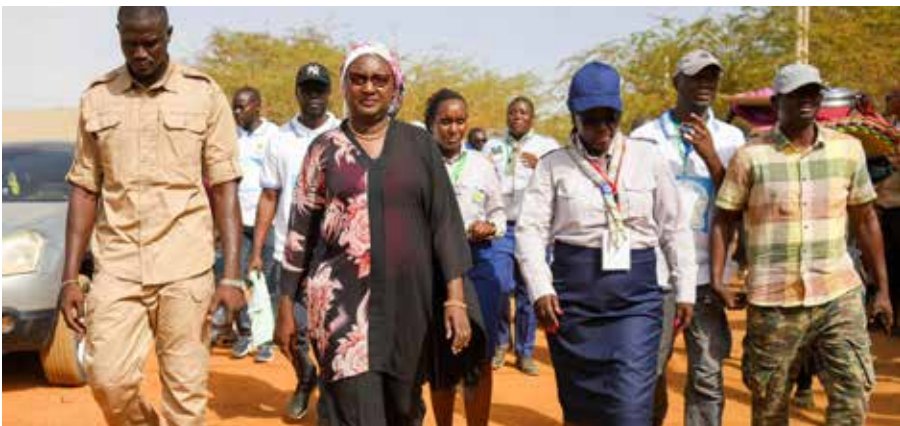
Communion avec les jeunes catholiques en route pour célébrer la 136 ème édition du Pèlerinage Marial de Popenguine