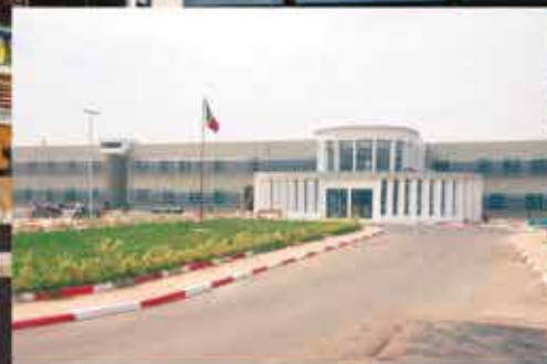
Hôpital Régional de Kaffrine