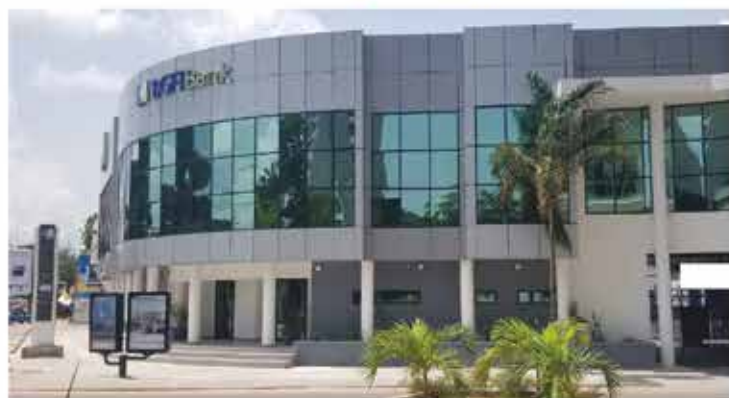
Siège BGFI Bank Brazzaville