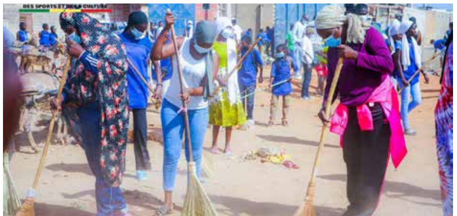
« Setal Sunu Réew » : Journée d'investissement humain à Joal-Fadiouth