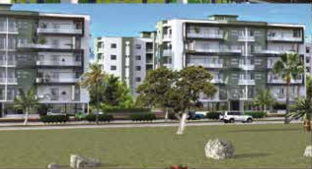
Les Résidences de l'Espoir Diamniadio