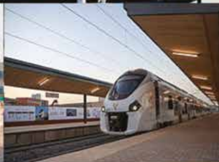
Gare TER de Kour Mbaye Fall et de Thiaryoye