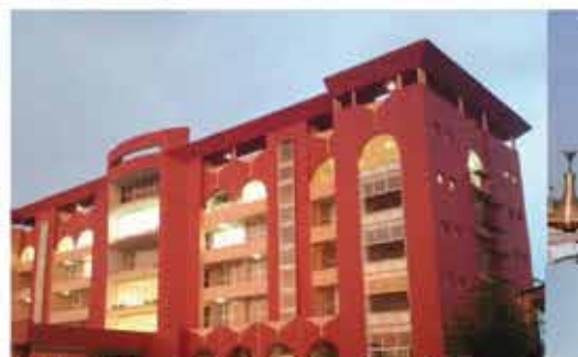
Direction de la Douane du Tchad