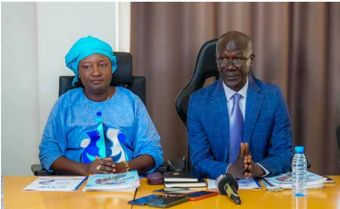
Madame Khady Diène Gaye, ministre de la Jeunesse, des Sports et de la Culture et Dr. Bakary Sarr, Secrétaire d'État à la Culture, aux Industries créatives et au Patrimoine historique

De Léopold Sédar SENGHOR à Amadou Moustar MBOW, Cheikh Anta DIOP, en passant par Doudou Ndiaye Rose, Youssou NDOUR, Cheikh Hamidou KANE, David DIOP, Boubacar Boris DIOP ou Souleymane Bachir DIAGNE, le Sénégal a offert et continue d'offrir au monde des figures et personnalités culturelles de dimension exceptionnelle.