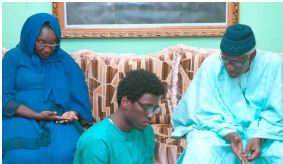
Visite de courtoisie auprès de Serigne Mbaye Sy Abdou Aziz Sy Dabakh